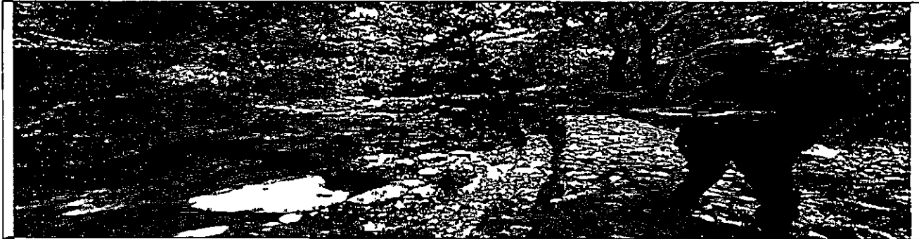
Figura 4. Zona de la vivienda a la margen derecha del Cauce