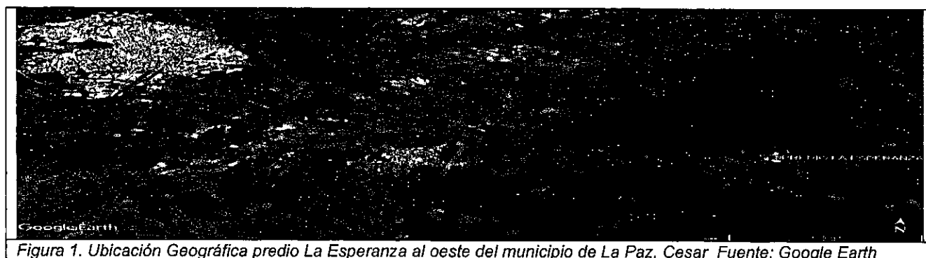
Figura 1. Ubicación Geográfica predio La Esperanza al oeste del municipio de La Paz, Cesar

Las coordenadas geográficas registradas durante la visita corresponden a 10°23'26.202"N y 73°5'28.734"O bajo el Datum WGS 84.