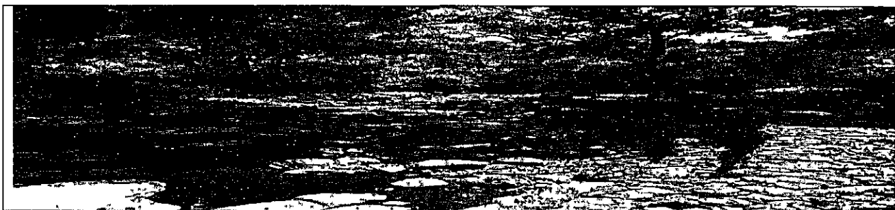
Figura 2. Gaviones recién construidos a laderas del Río Manaure