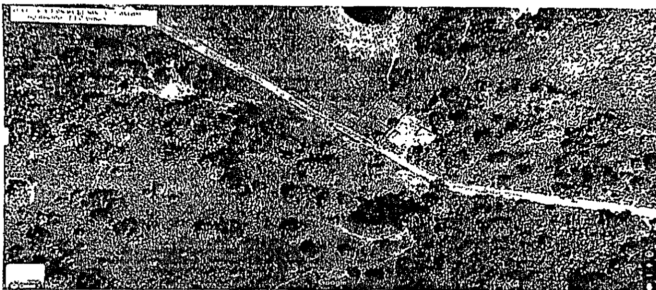
Imagen del área de la presunta infracción ambiental

CONTINUACIÓN DEL AUTO No. _____ DE _____, POR EL CUAL SE ORDENA EL ARCHIVO DE UNA INDAGACIÓN PRELIMINAR _____ 2