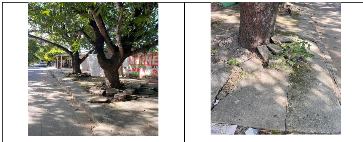
Tabla 1 Especie y cálculo de volúmenes de los árboles a intervenir con tala en Calle 8 N° 7-40 del Barrio San Isidro del municipio de Curumaní- Cesar.