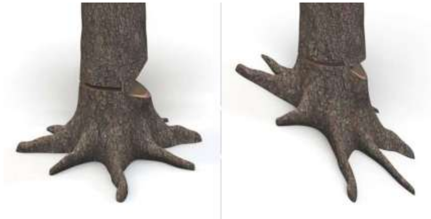
Ilustración 1. Corte Direccional