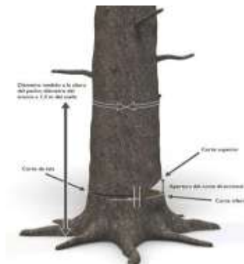
Ilustración 2. Corte de Tala