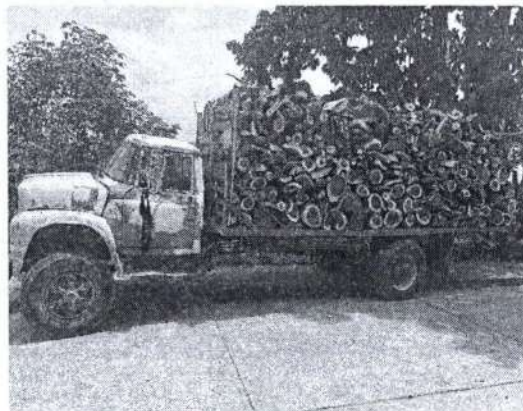
Fotografía 1. Ingreso de vehículo cargado con trozas tipo recorte de madera de la especie Algarrobilllo ( Albizia saman ).