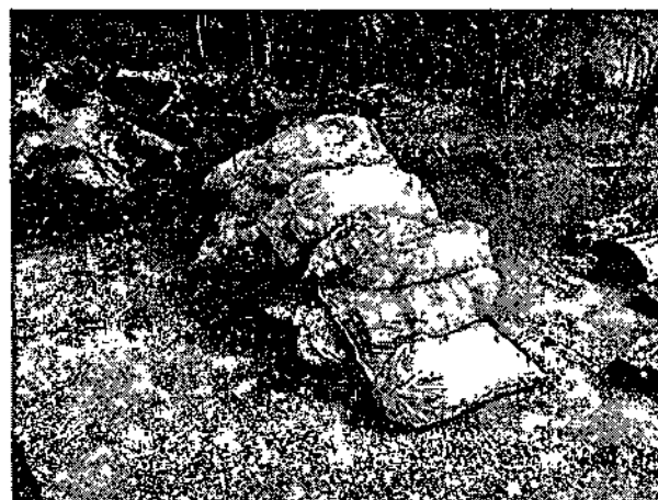
Fotografía 2. Proceso de cuantificación, pesaje y ubicación de los 16 bultos de Carbón Vegetal que corresponden a una carga de 0,224 toneladas.