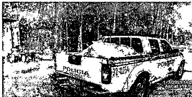
Fotografía 1. Ingreso de vehículo perteneciente a la Fuerza Pública, cargado con 16 bultos de Carbón Vegetal.