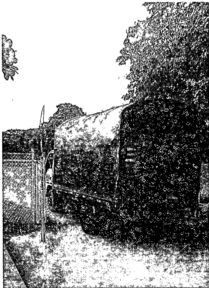
Fotografía 1. Ingreso de vehículo perteneciente a la Fuerza Pública cargado con trozas tipo recorte de madera de la especie Cauchero ( Ficus elastica ).