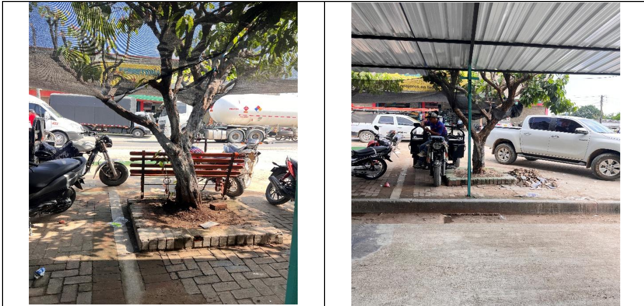
Tabla 1 Especie y cálculo de volúmenes de los árboles a intervenir con tala en Diagonal 2 N° 9ª-29 del barrio El Centro del municipio de Curumaní- Cesar.