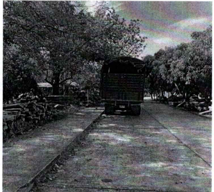
Fotografía 1. Vehículo infractor cargado con la madera incautada.