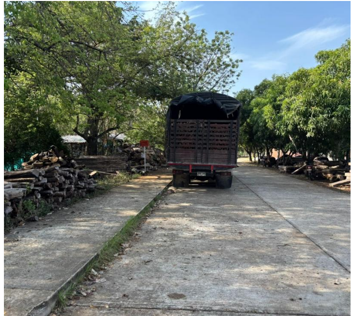
Fotografía 1. Vehículo infractor cargado con la madera incautada.