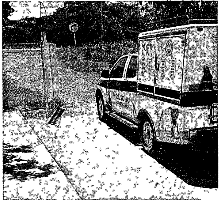
Fotografía 1. Proceso de ingreso y la salida del vehículo perteneciente a la fuerza pública cargado con el carbón vegetal que corresponden a una carga de 0,24 toneladas.