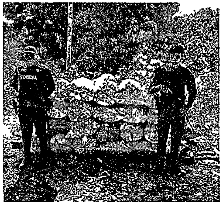
Fotografía 1. Procedimiento de decomiso realizado por la Fuerza Pública.