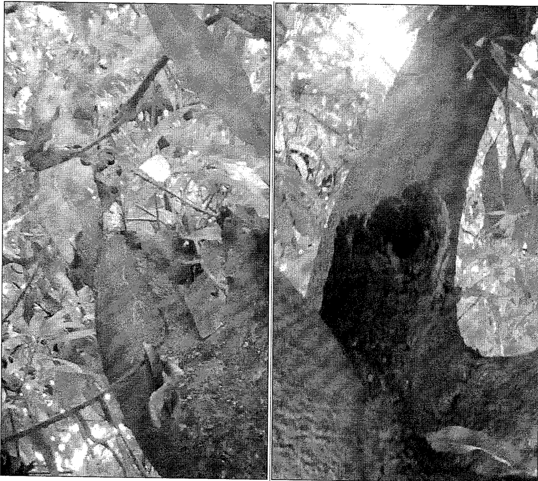
Tabla 1. Datos Técnicos del Árbol de Mango

Continuación Resolución No. 0159 de 16 SEP 2019 . Por medio de la cual se otorga se otorga autorización al Municipio de Valledupar, con identificación tributaria N°800.098.911 - 8 para efectuar intervención forestal sobre arboles aislados localizados en centros urbanos mediante la tala de un árbol ubicado en la calle 18C N°. 63 - 78, barrio Villa Luz, del Municipio de Valledupar – Cesar”.