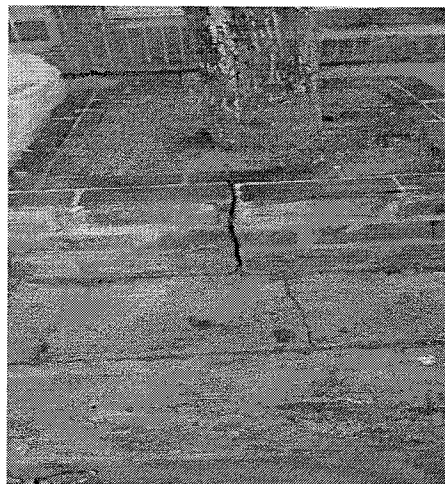
Fotografía 2. Contenedor del árbol Olivo Negro agrietado por falta de espacio para el libre desarrollo de las raíces.

Las características del árbol a intervenir ubicado en la carrera 5A No 39-44, barrio Panamá de la ciudad de Valledupar, se detallan en la siguiente tabla 1: