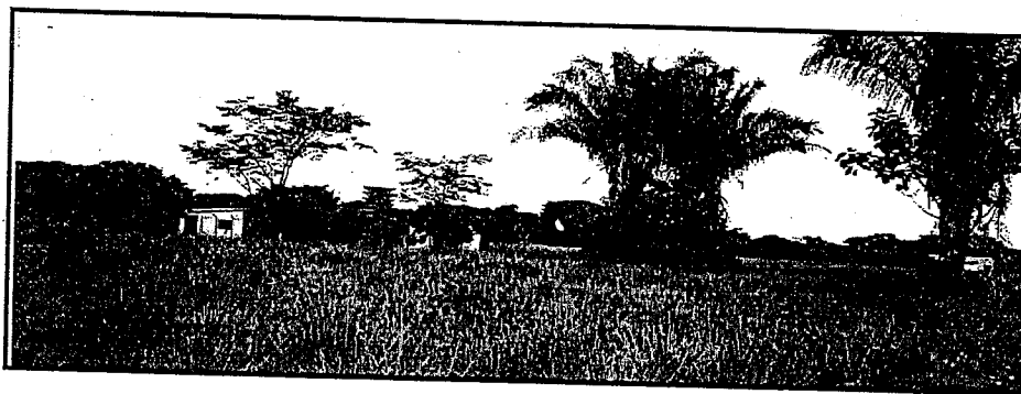
Foto: Predio de Matricula inmobiliaria No. 196-29810, Aguachica, Cesar 2019.

El sitio donde se tiene previsto la exploración de aguas subterráneas se encuentra en el predio de Matricula inmobiliaria No. 196-29810, el cual ostenta un área de 54 hectáreas con 8524.80 m 2